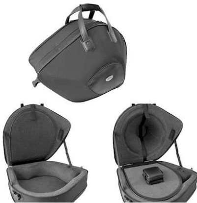
1170 und 5583