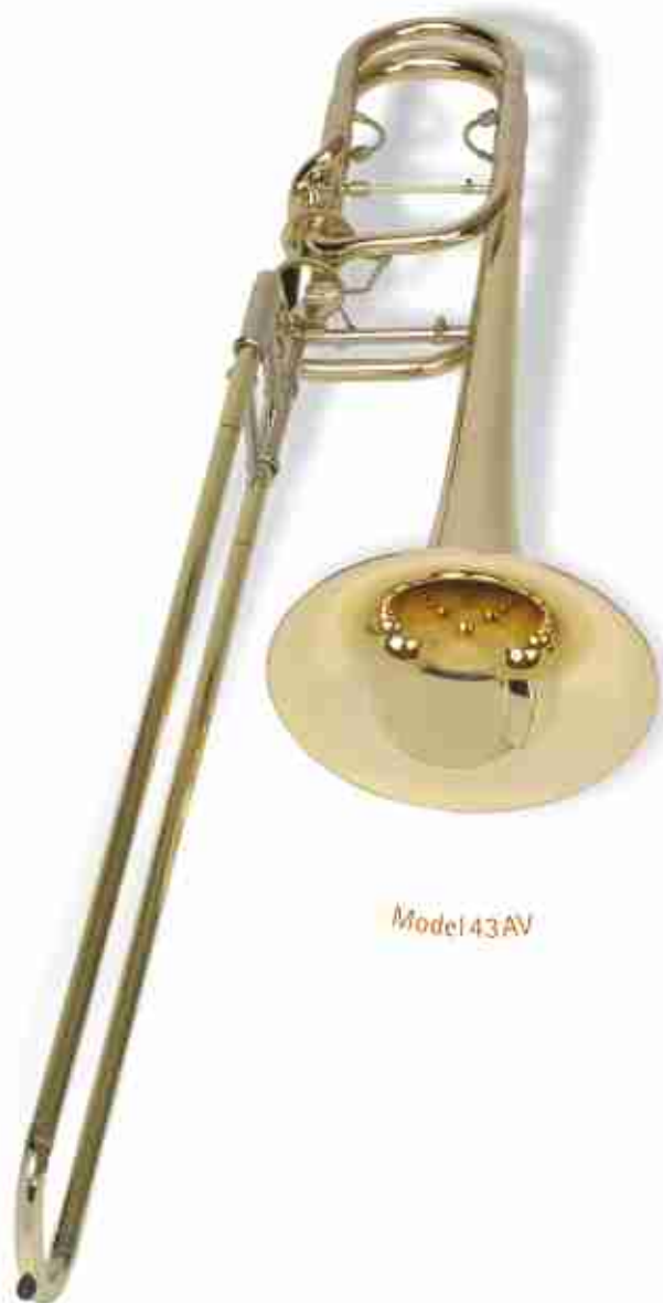
Model 43 AV