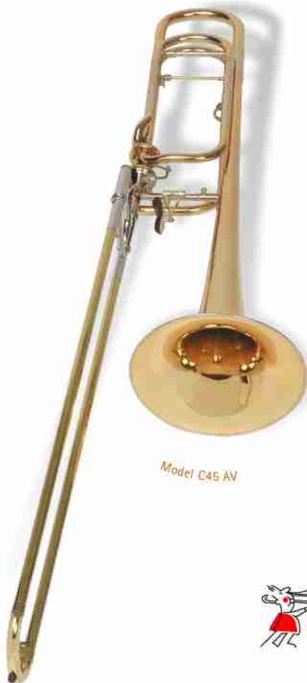
Model C45 AV