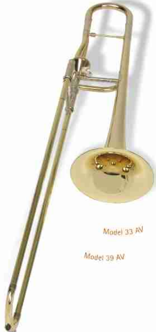
Model 33 AV